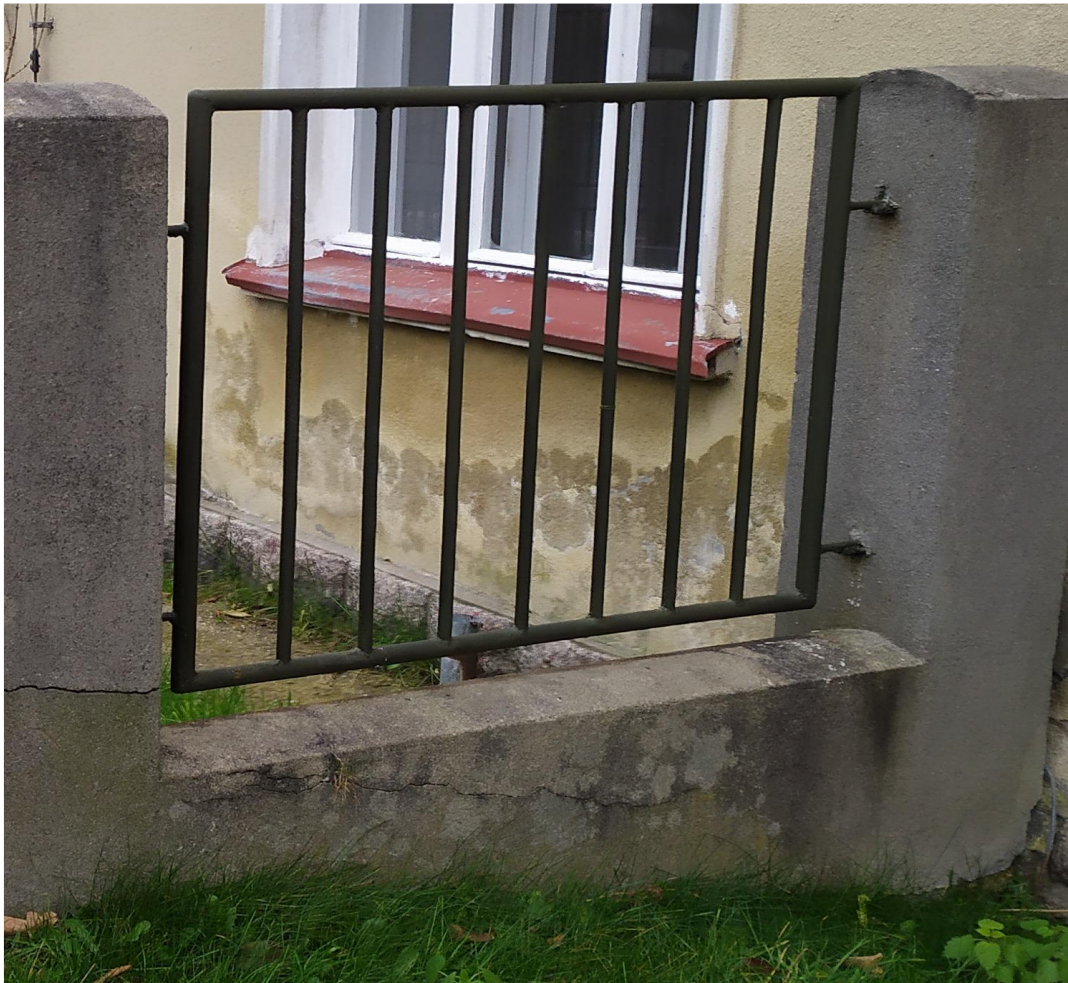
Z10 - PLOT